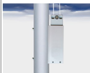
Typ HV-1 Außenliegende Universal Hissvorrichtung