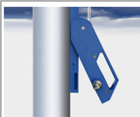
Typ HV-9 Außenliegende Hissvorrichtung für Fahnenmasten ø 75- 100 mm