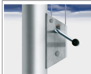
Typ HV-23 Außenliegende Universal Kurbel Hissvorrichtung