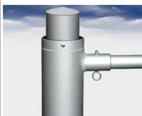
Typ DF Ausleger am Fahnenmast fixierter Drehausleger, Ø: von 55-100 mm