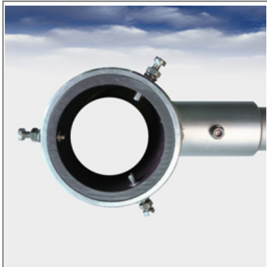
UDF Drehausleger Draufsicht