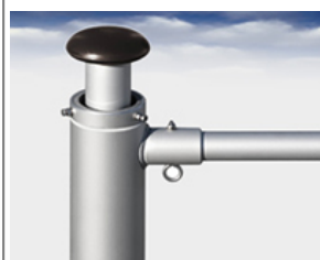
Typ UDF Ausleger am Fahnenmast fixierter Drehausleger, Ø: von 55-100 mm