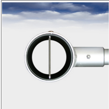
DF Drehausleger Draufsicht