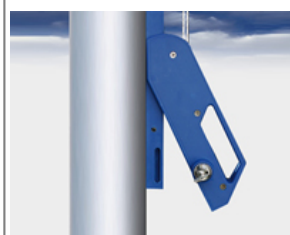
Typ HV-9 Außenliegende Hissvorrichtung für Fahnenmasten Ø 75-100 mm