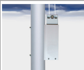
Typ HV-1 Außenliegende Universal Hissvorrichtung