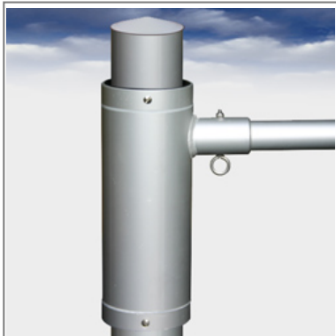
DF Drehausleger montiert