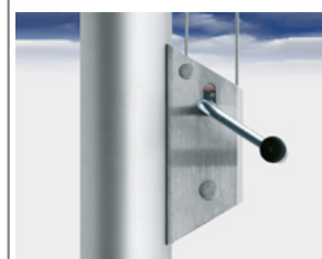
Typ HV-23 Außenliegende Universal Kurbel Hissvorrichtung