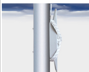
Typ HV-0 Außenliegende Universal Hissvorrichtung mit Klampe