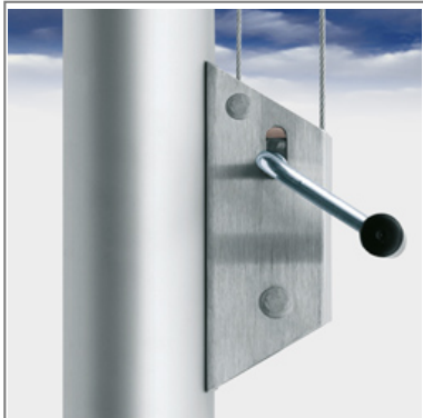
Kurbel Hissvorrichtung unten