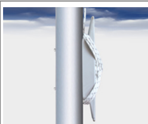
Typ HV-0 Außenliegende Universal Hissvorrichtung mit Klampe